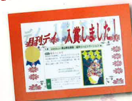
◀毛糸で彩られた厚生の乙女花:通所リハビリ共同作品