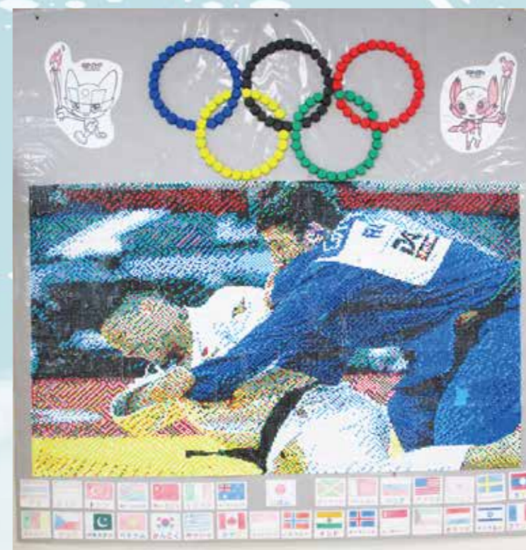
38400枚の小さなシールで彩られた点描画(通所リハビリ共同作品)