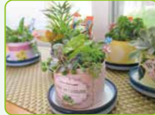
完成した多肉植物