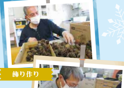
飾りも全て手作りです。