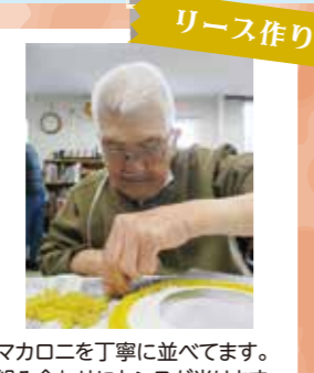
マカロニを丁寧に並べてます。 組み合わせにセンスが光ります。