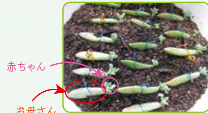
▲多肉植物の赤ちゃん ▲多肉植物のお母さん