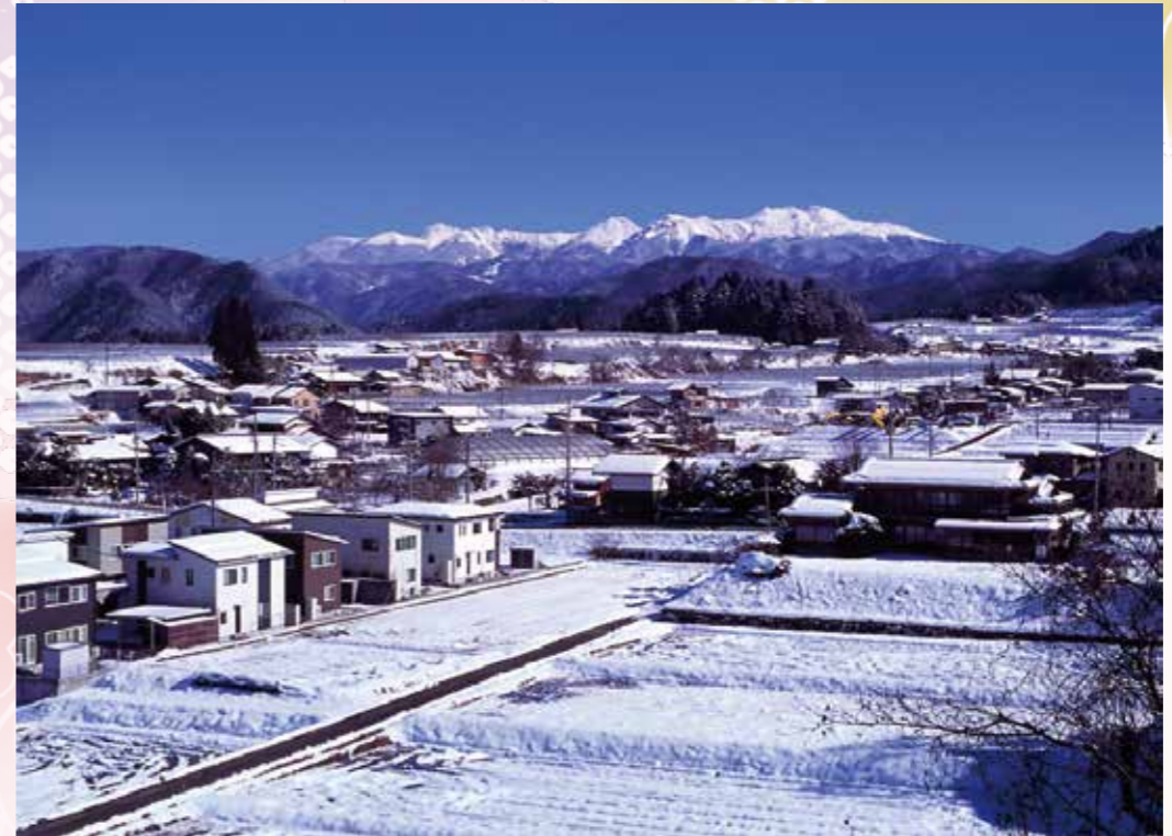
冬晴れの乗鞍岳 西野 聡