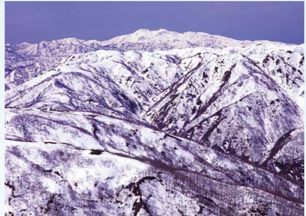
白木峰より望む白山連峰 西野 聡