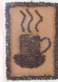
コーヒー豆 壁掛け

今年度は利用者さん一人ひとりの想いや能力・特性・生活背景などをふまえ、個別の支援を試みました。作品を作ること自体が目的ではなく「精神面・意欲の賦活」「生きがいや役割を持って生活できる」「集団の中での役割・出番作り」を目指して取り組みました。