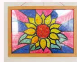
「ステンドグラス風」ぬり絵