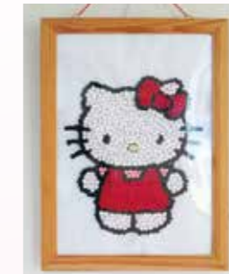
モザイクアートのキティちゃん

机の上に置かれた花を見て、ささっとデッサン！初めて書かれたとは思えない出来栄です。