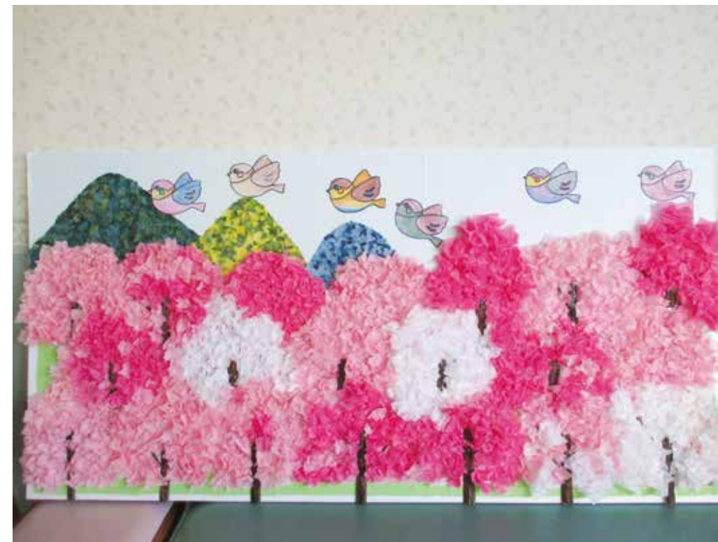
通所リハビリ共同作品